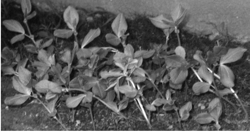
Şəx. 1. Tədqiqat sahəsindən bir görünüş.

Tədqiqat obyektini kimi, Vicia faba – at paxlasından istifadə edilmişdir. V. faba – birillik ot bitkisidir. Gövdəsi dik qalxan və 10-100 sm. ölçüdə, yarpaqları yumurta şəkilli, ucu üçbucaqlı iti, ölçüsü 20-30 mm. Tədqiqat sahələrində əkilmiş toxumdan bitkilər 18-25 sm. hündürlüyə qalxmışdır. Bu ölçü onların inkişafının 18-22 günlərində olmuşdur. Bitkinin I və II cüt yarpaqları nisbətən iri 20-35 mm., III cüt 15-25 mm olmuşdur (Şəkil 1).